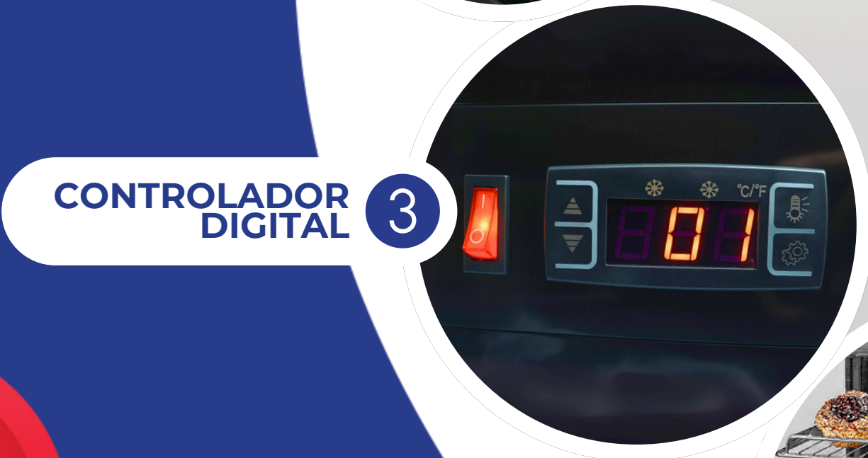
CONTROLADOR DIGITAL 3