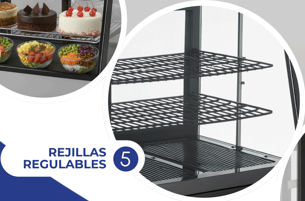
REJILLAS REGULABLES 5