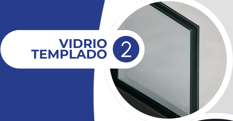
VIDRIO TEMPLADO 2