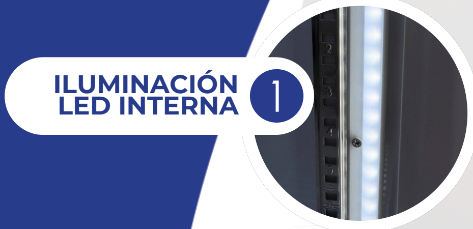
ILUMINACIÓN LED INTERNA 1